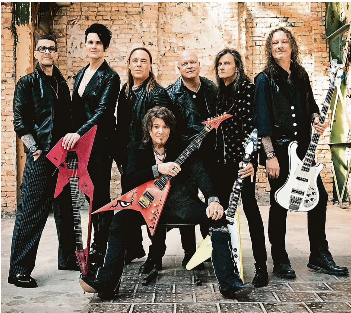
Helloween Legendární německá skupina vznikla v roce 1984 v Hamburku, první desku vydala rok poté. Je považována za zakladatele power metalu a průkopníka melodického speed metalu. Její tvorba definovala celý žánr typický rychlými kytarovými sóly a epickými melodiemi.

gii, že se to samotným muzikantům zalíbilo. Následně spolu obě kapely jely turné a předváděly tuto společnou show po celém světě. Chyběl už jen Kiske. A když se přidal, vznikli Pumpkins United.